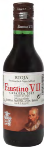
Vino tinto español Faustino VII, Rioja Spanish red wine Faustino VII, Rioja Vino rosso spagnolo Faustino VII, Rioja

Solo se podrán consumir bebidas alcohólicas adquiridas en este vuelo. Only alcoholic drinks purchased on this flight may be consumed. È possibile consumare solo bevande alcoliche acquistate su questo volo.