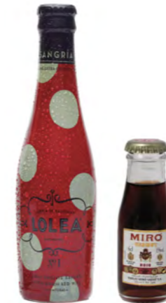
APERITIVO APÉRITIF / APERITIVO

Sangría o vermut Sangría or vermouth Sangría o vermut