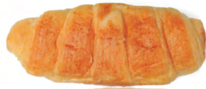
SNACK DULCE SWEET SNACK / SNACK DOLCI

Kit Kat o croissant o Mikado Kit Kat or croissant or Mikado Kit Kat o croissant o Mikado