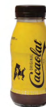
Batido de chocolate ✨ Cacaolat 20 cl Cacaolat chocolate shake 20 cl Bibita al cioccolato Cacaolat 20 cl