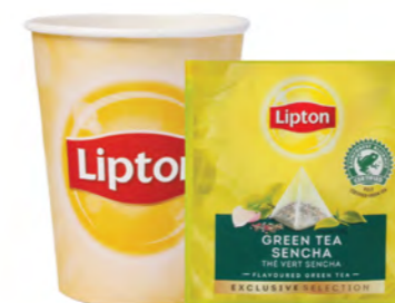
Té verde Sencha Lipton Lipton Green Tea Sencha Tè verde Sencha Lipton