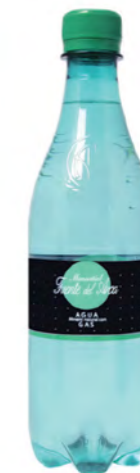
Fuente del Arca Agua con gas 50 cl Sparkling water 50 cl Acqua frizzante 50 cl