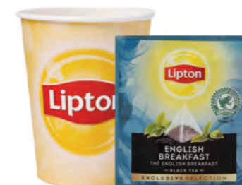
Té negro English Breakfast Lipton Lipton Black Tea English Breakfast Tè nero English Breakfast Lipton