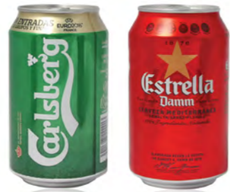
CERVEZA BEER / BIRRA