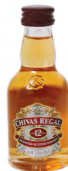
Whisky Chivas Regal 12 años (5 cl) Chivas Regal whisky 12 years (5 cl) Whisky Chivas Regal 12 anni (5 cl)