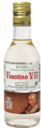
Vino blanco español Faustino VII, Rioja Spanish white wine Faustino VII, Rioja Vino bianco spagnolo Faustino VII, Rioja