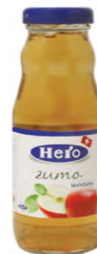
Manzana / Naranja / Tomate 20 cl Apple / Orange / Tomato 20 cl Mela / Arancia / Pomodoro 20 cl