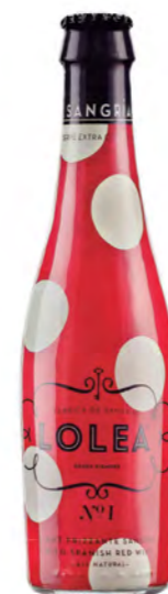
Sangría Lolea 25 cl