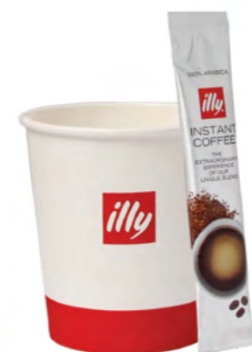
Café illy illy Coffee Caffè illy