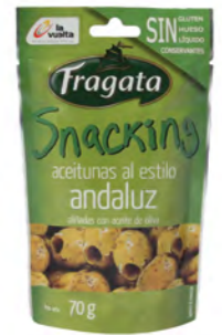
SNACK SALADO SAVOURY SNACK / SNACK SALATI

Chips Marinas o aceitunas o cacahuets Marinas crisps or olives or peanuts Chips Marinas o olive o arachidi