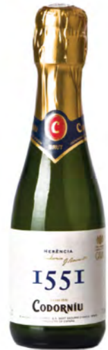
Cava Brut Nature Codorníu 1551