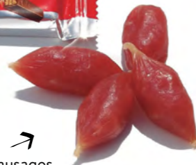
Mini fuet Mini Spanish cured sausages Salamini