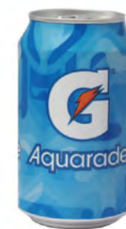
G Aquarade de limón G Aquarade Lemon G Aquarade limone