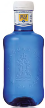
BEBIDA DRINK / BIBITA

Zumo o café o té o agua sin gas o batido de chocolate Juice or coffee or tea or still water or chocolate shake Succo o caffè o tè o acqua naturale o bibita al cioccolato