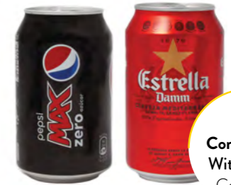
BEBIDA DRINK / BIBITA

Agua sin gas o refresco* Still water or soft drink* Acqua naturale o bibita analcolica*