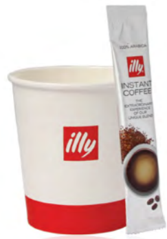
BEBIDA DRINK / BIBITA

Zumo o café o té o batido de chocolate Juice or coffee or tea or chocolate shake Succo o caffè o tè o bibita al cioccolato