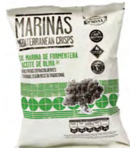
SNACK SALADO SAVOURY SNACK / SNACK SALATI

Chips Marinas o cacahuets Marinas crisps or peanuts Chips Marinas o arachidi