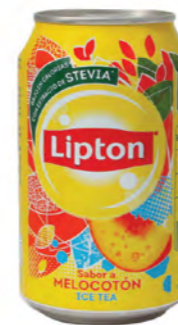
Lipton® Ice Tea Melocotón Peach Pesca