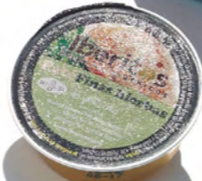
Paté de finas hierbas Fines herbes pâté Paté di fine erbe