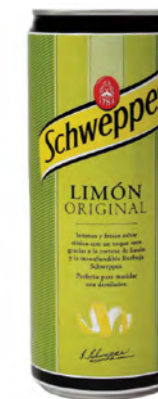
Schweppes de limón