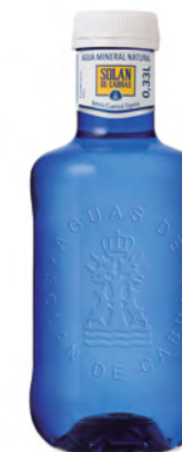
Solán de Cabras Agua sin gas 33 cl Still water 33 cl Acqua naturale 33 cl